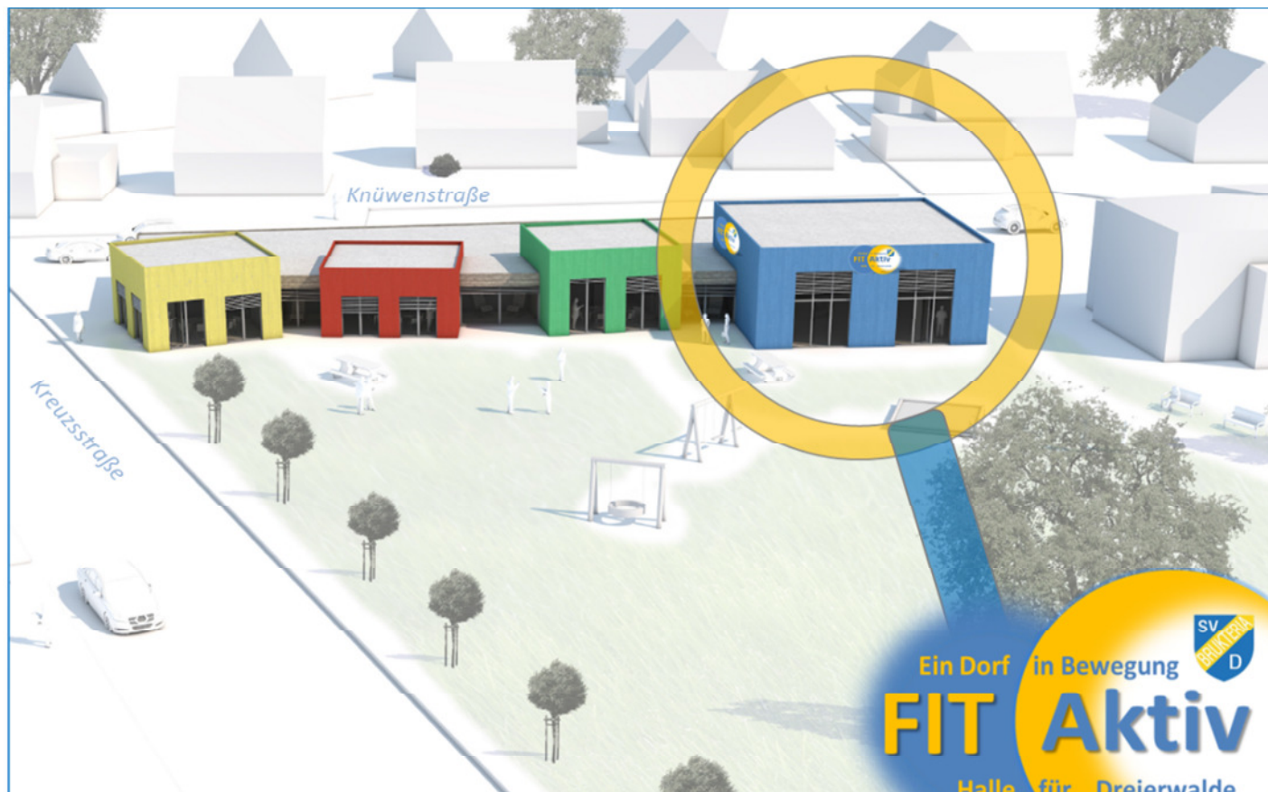
DRK-Kindergarten Dreierwalde mit Fit Aktiv Halle Brukterria Dreierwalde © Architekturbüro Ludger Feldhaus