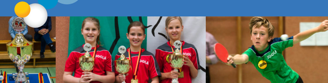
Bundesfinale 2015 in Delmenhorst

Ein umfangreiches Rahmenprogramm wird alle Minis begeistern, die sich für das Bundesfinale in Rosenheim (Bayern) qualifizieren.